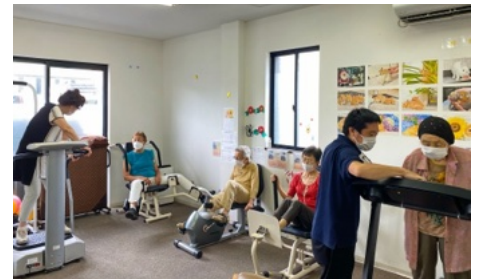
トレーニングマシン