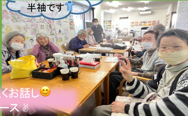
暖かくなってきたので半袖です👕