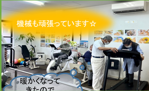
機械も頑張っています☆