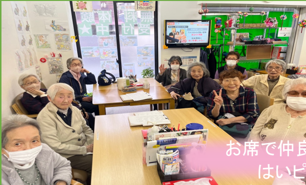
お席で仲良くお話し😊 はいピース👌