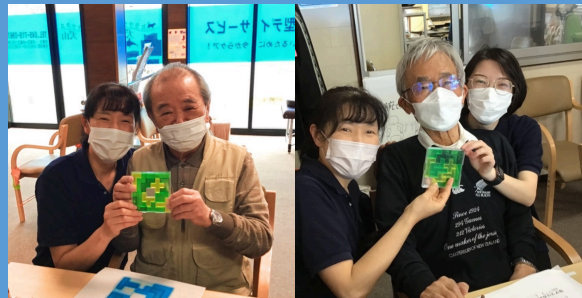
難解パズル完成記念♪