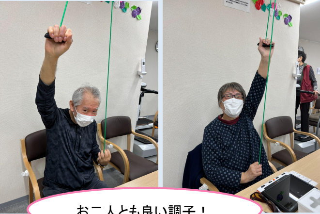
お二人とも良い調子！